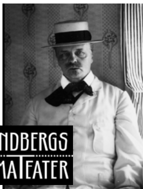
Hemsöborna, en av August Strindbergs mest älskade böcker.