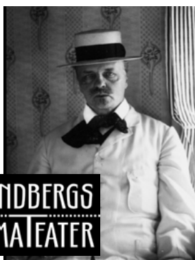
Hemsöborna, en av August Strindbergs mest älskade böcker.